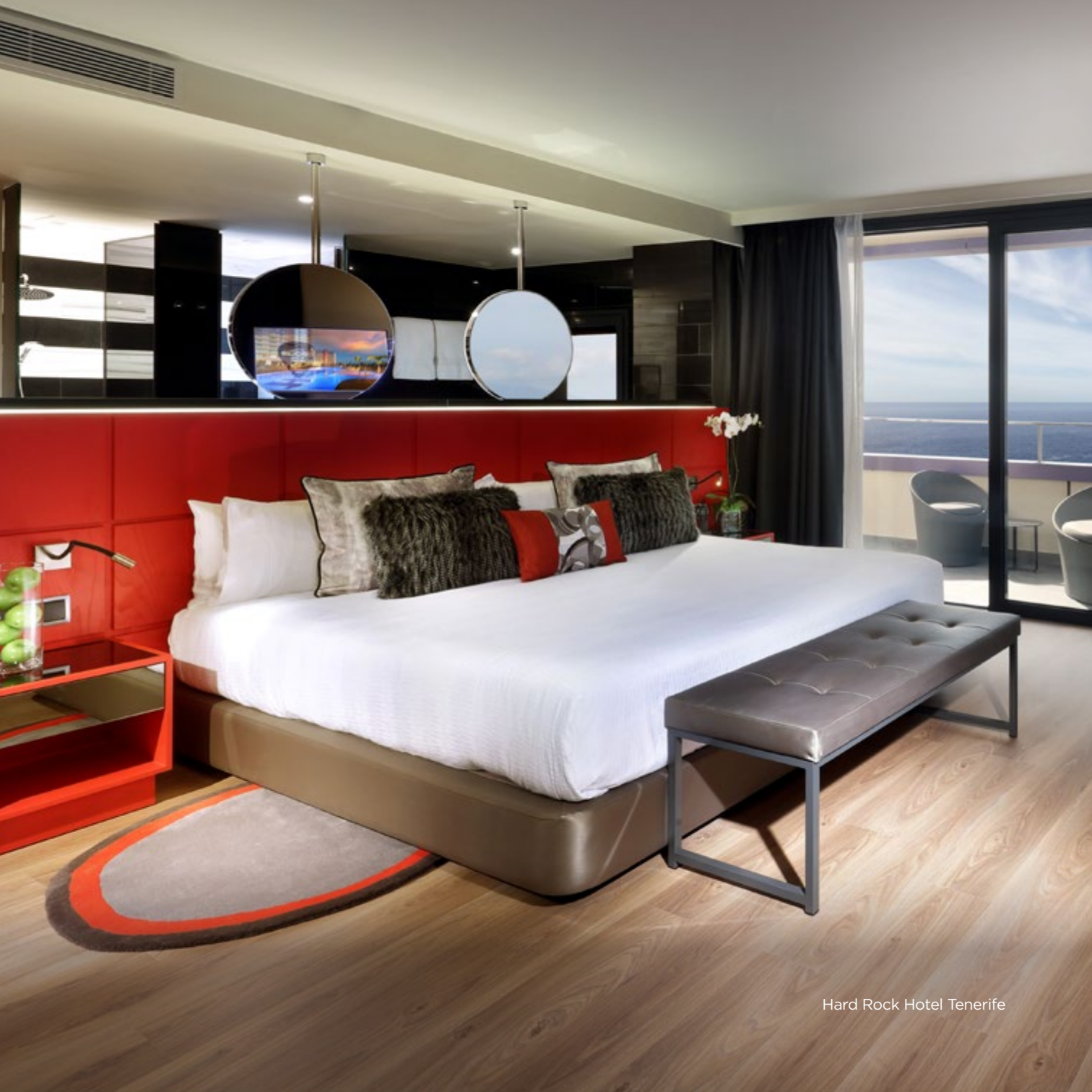
Hard Rock Hotel Tenerife