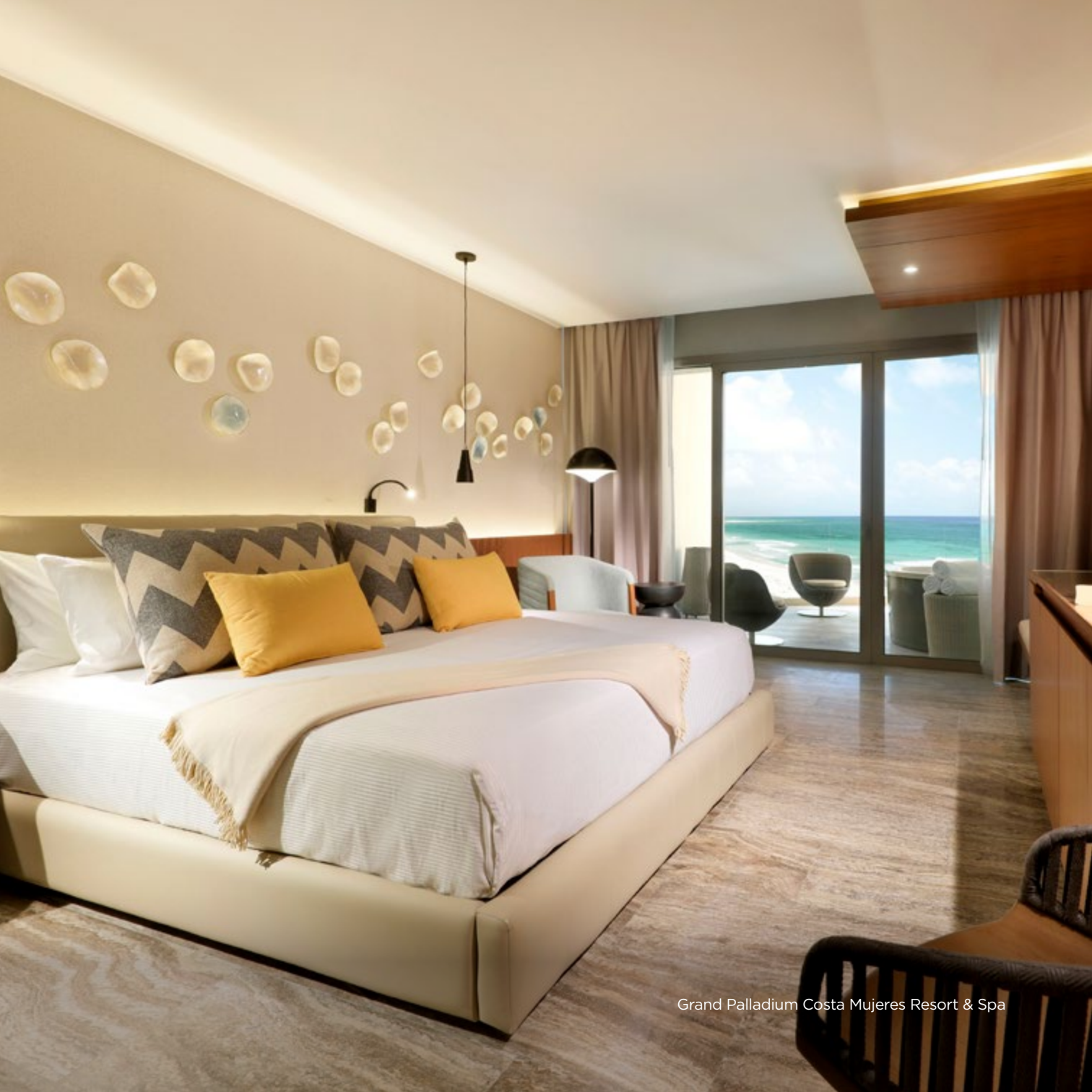
Grand Palladium Costa Mujeres Resort & Spa