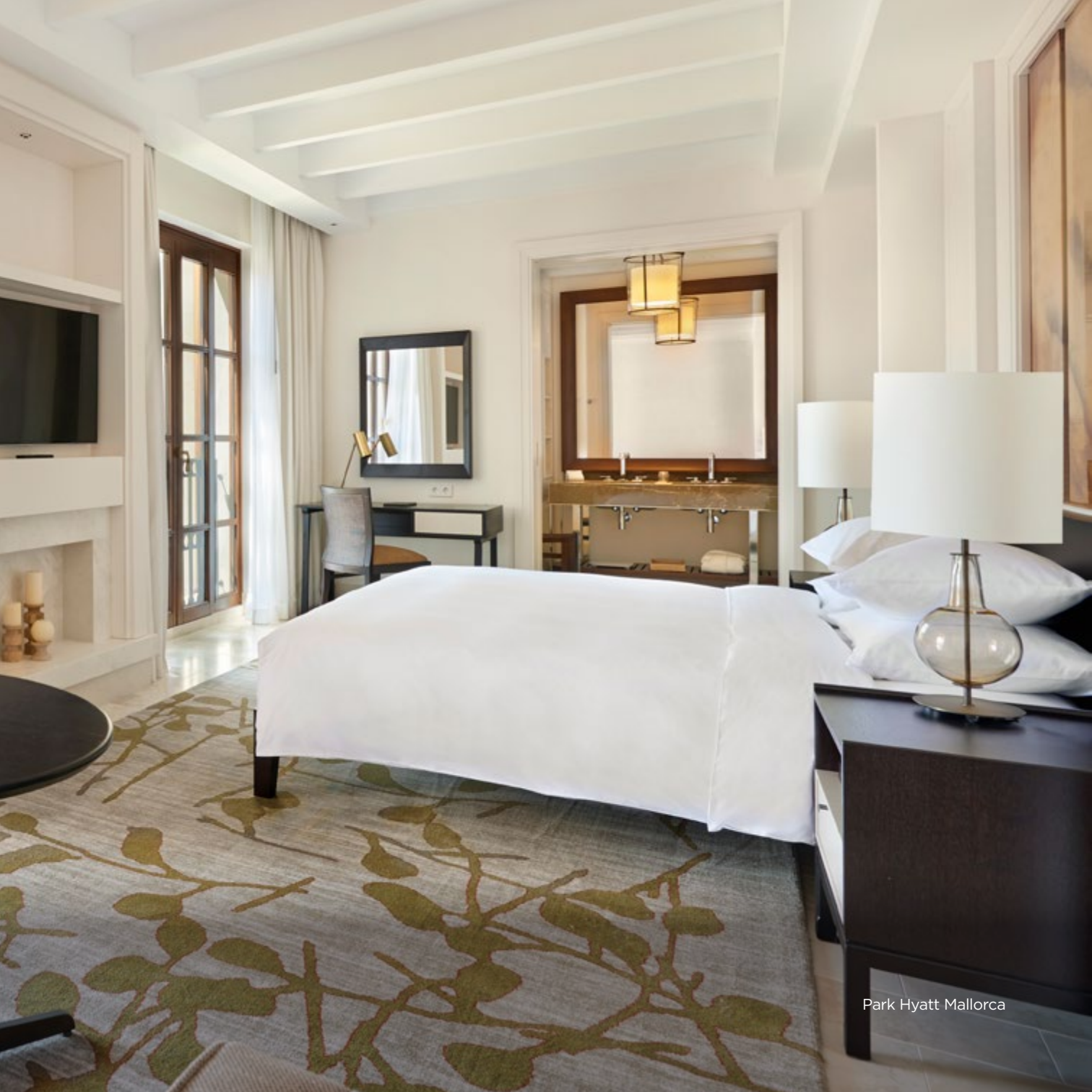
Park Hyatt Mallorca