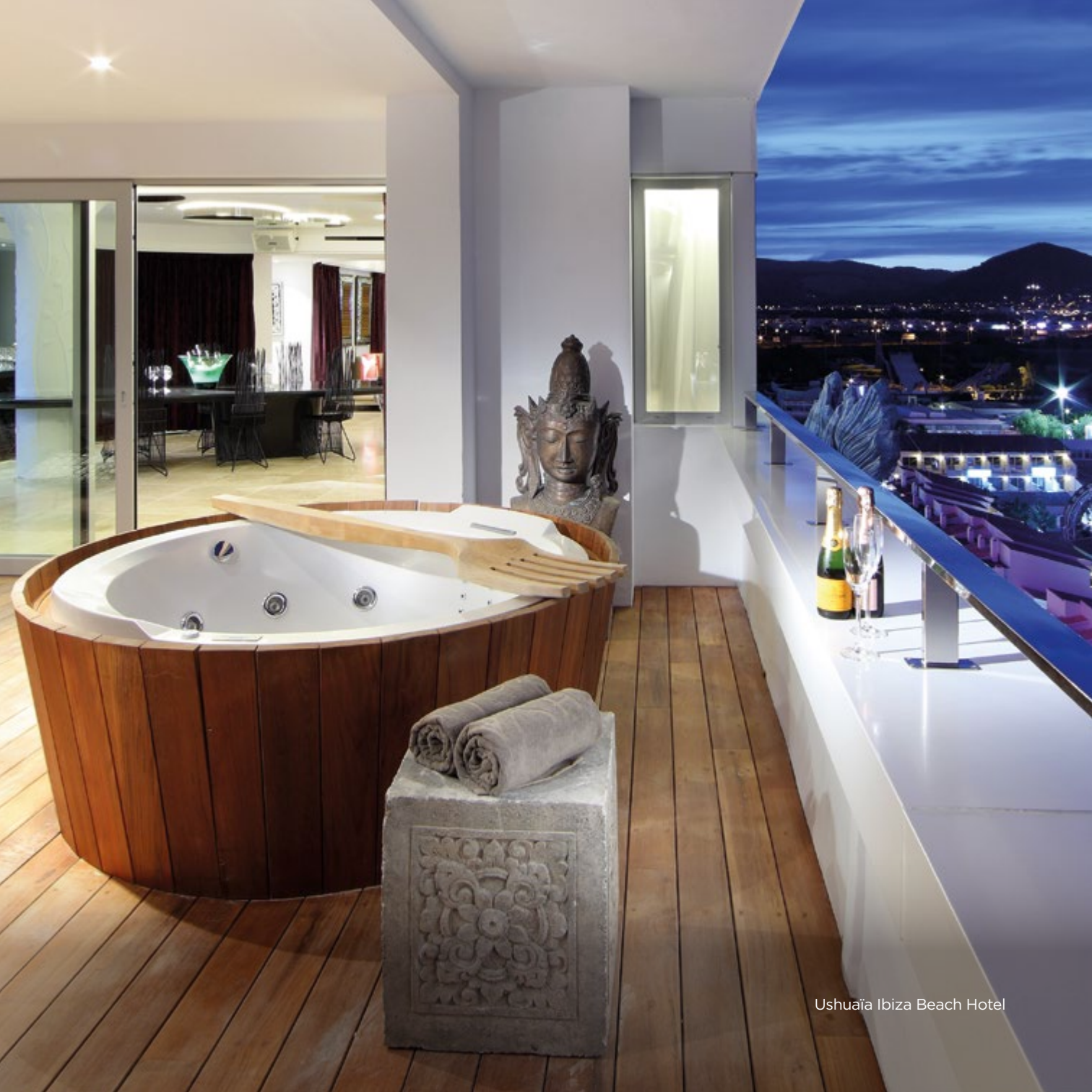
Ushuaia Ibiza Beach Hotel