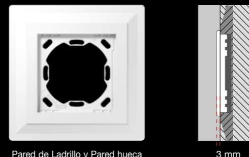
Pared de Ladrillo y Pared hueca

Marco de yeso con perfil de 3 mm para cubrir los bordes con papel pintado o yeso