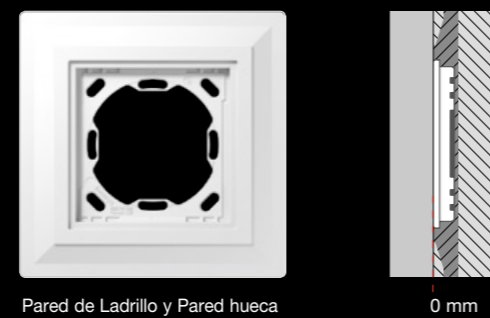
Pared de Ladrillo y Pared hueca