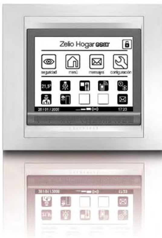
Pantalla táctil para Zelio Hogar GSM V09