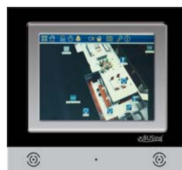
Medidas reales: 33 x 30 cm