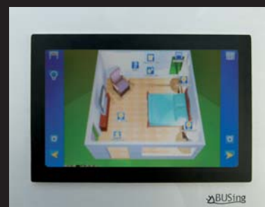
Medidas reales: 22,5 x 17 cm

La inmótica cobra especial sentido cuando se busca optimizar los consumos y aportar un control exhaustivo de la energía necesaria para mantener un ambiente agradable sin gastos excesivos. Nuestros dispositivos actúan de forma inteligente sobre el clima y la iluminación, permitiéndote alcanzar los más altos estándares de confort con el mínimo impacto sobre el medio ambiente y el consumo del edificio