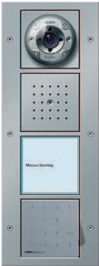
67 65 66