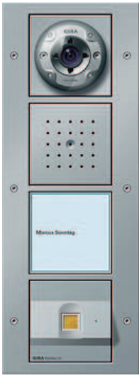
67 65 66